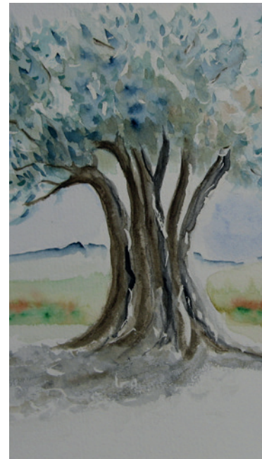
Catherine Mérat (représentation partielle)

Ou sur rendez-vous au 079 704 28 75 info@espace-murandaz.ch | www.espace-murandaz.ch